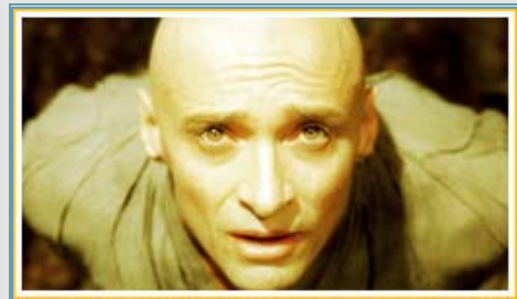
Plano picado puro