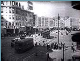
Gran plano general

La clasificación de planos está referenciada a la figura humana.