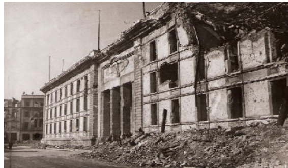
El edificio de la Cancillería en Mayo 1945