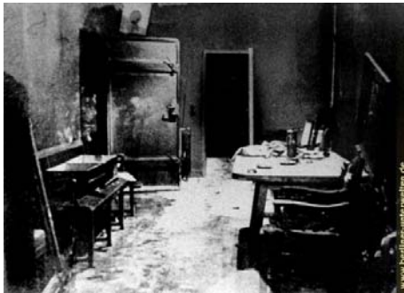
El interior del Bunker