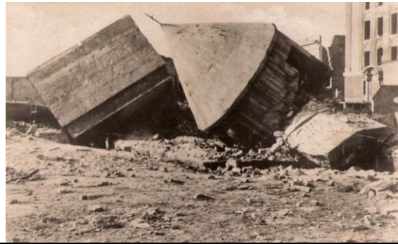
El Bunker demolido en 1947